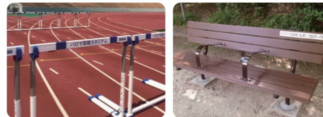
寄附したハードルやベンチ