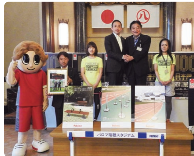
贈呈の様子(名古屋市の河村市長と固い握手を交わす小林社長)

2016年6月24~26日、「パロマ瑞穂スポーツパーク」で第100回日本陸上競技選手権大会が開催されました。それに合わせてハードルやパラソルなどの陸上大会で使用する備品や、周囲の児童園で使われるベンチを名古屋市へ寄附させていただきました。