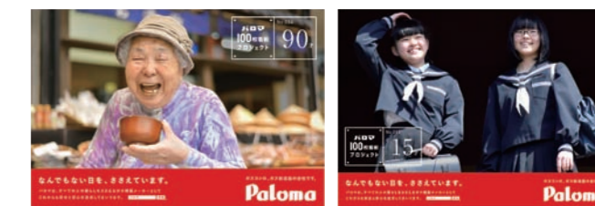
全部で「100種類」の看板を掲出中。WEBページではすべての写真を見ることができます