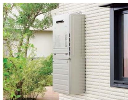
周辺環境との調和にこだわったシンプルで美しいデザインの給湯器「プライツ」。GOOD DESIGN賞受賞。

中では1位の実績を残すことができませんでした。私の所属する福岡営業所は、なんでも話し合えるチームワークが自慢です。近年のパロマは、「プライツ」や「ラ・クック」など魅力的な製品やオプション品がより一層充実してきました。また、自社のサービスタッフがきめ細かいアフターメンテナンスを行っているのも強み。これを活かして福岡営業所の売上をさらに伸ばし、九州市場のシェア拡大を牽引していきたいですね。