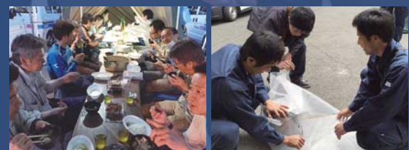
被災当時の様子。駐車場にテントを張り業務を再開。物流が混乱する中、修理した炊飯器を自分達でお届けする等、暮らしを支えるメーカーとしての役割を果たせるよう務めました。

業務を再開したのは、本震から2日後です。余震が続く事務所には危険だったので、駐車場にテントを張り、そこに机やパソコン、電話などを並べて活動できる体制を整えました。ここを拠点にして他の支店や営業所から応援に駆けつけてくれた人々と協力し、緊急対応に追われていた都市ガス事業者さまやLPガス事業者さまのサポートに奔走しました。