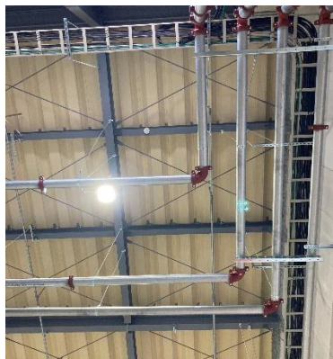
スプリンクラー完備