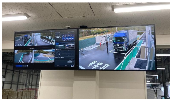
事務所内モニターで安全を確認

また、本センターでは「ホワイト物流」推進の一環として、荷受け・積載エリアの屋根付き化により、天候の影響低減を図るとともに、ドライバーの安全性向上と作業効率の確保を目指します。あわせて、ドライバー用の休憩室やシャワールームを設置し、女性ドライバー専用のシャワールームやパウダースペース、トイレも完備しました。ドライバーの皆様が快適かつ安全に業務に従事できる環境づくりを通じて、物流品質のさらなる向上を目指してまいります。お客様をはじめ、パロマに関わるすべての皆様に安心と快適をお届けしてまいります。