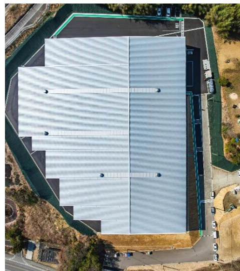
(株)パロマ 西日本ロジスティクスセンター

本センターは、名古屋から中四国・九州エリアを結ぶ物流ネットワークの中核拠点として位置づけ、高速道路への良好なアクセス環境を活かし、広域配送および中継輸送の効率化を図ります。立地は、東広島自動車道「黒瀬 IC」から車で約5分と、高速道路網への接続性に優れており、大型車両の円滑な運行が可能です。この立地特性により、中四国エリアに加え、九州全域への安定的かつ効率的な配送体制を構築します。また、名古屋～九州間の長距離輸送においては、本センターを中継拠点とすることで、ドライバーの適切な休息時間の確保と輸送効率の両立を図り、法令遵守と安定供給の実現に寄与します。